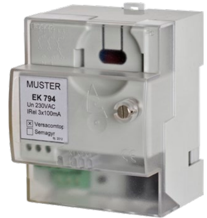
▲ EK794 - Funkrundsteuerempfänger