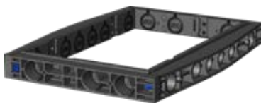
Rahmen 70 mm Art.-Nr.: 06 368 0058E 3 x Ø 50 6 x Ø 50 Gewicht: 3,8 kg