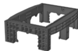
Rahmen 220 mm überbaubar Art.-Nr.: 06 368 0072E 1 x Rechteck 2 x Rechteck Gewicht: 10,5 kg