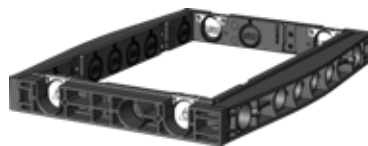
Rahmen 70 mm überbaubar Art.-Nr.: 06 368 0358E 2 x überbaubar / 1 x Ø 50 6 x Ø 50 Gewicht: 3,8 kg