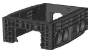
Rahmen 220 mm überbaubar Art.-Nr.: 06 368 0073E 1 x Rechteck 4 x Ø 110 Gewicht: 12,5 kg