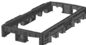
Rahmen 220 mm überbaubar Art.-Nr.: 06 728 0087E 2 x Rechteck / 1 x Ø 110 4 x Rechteck / 1 x Ø 110 Gewicht: 54,0 kg