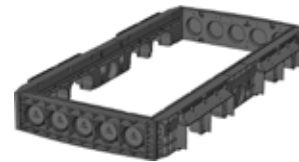
Rahmen 220 mm überbaubar Art.-Nr.: 06 728 0085E 5 x Ø 110 4 x Rechteck / 1 x Ø 110 Gewicht: 40,0 kg