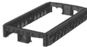
Rahmen 220 mm überbaubar Art.-Nr.: 06 728 0061E 2 x Rechteck / 1 x Ø 110 9 x Ø 110 Gewicht: 50,0 kg